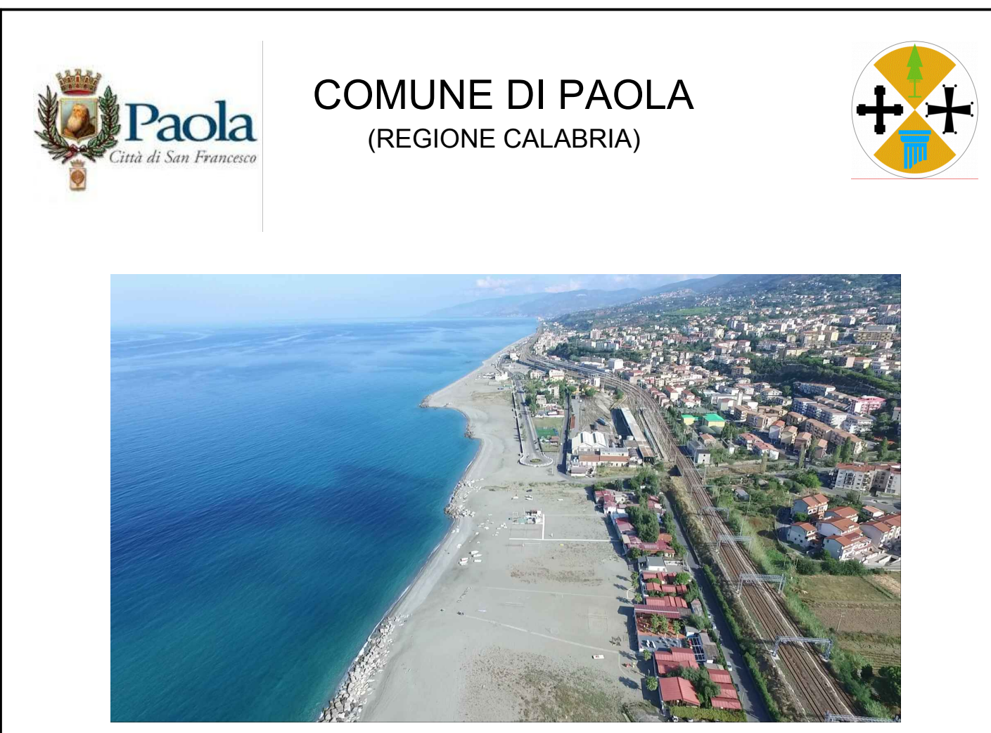
Arenile in località Pantani - post operam FOTOSIMULAZIONE della tipologia prevista