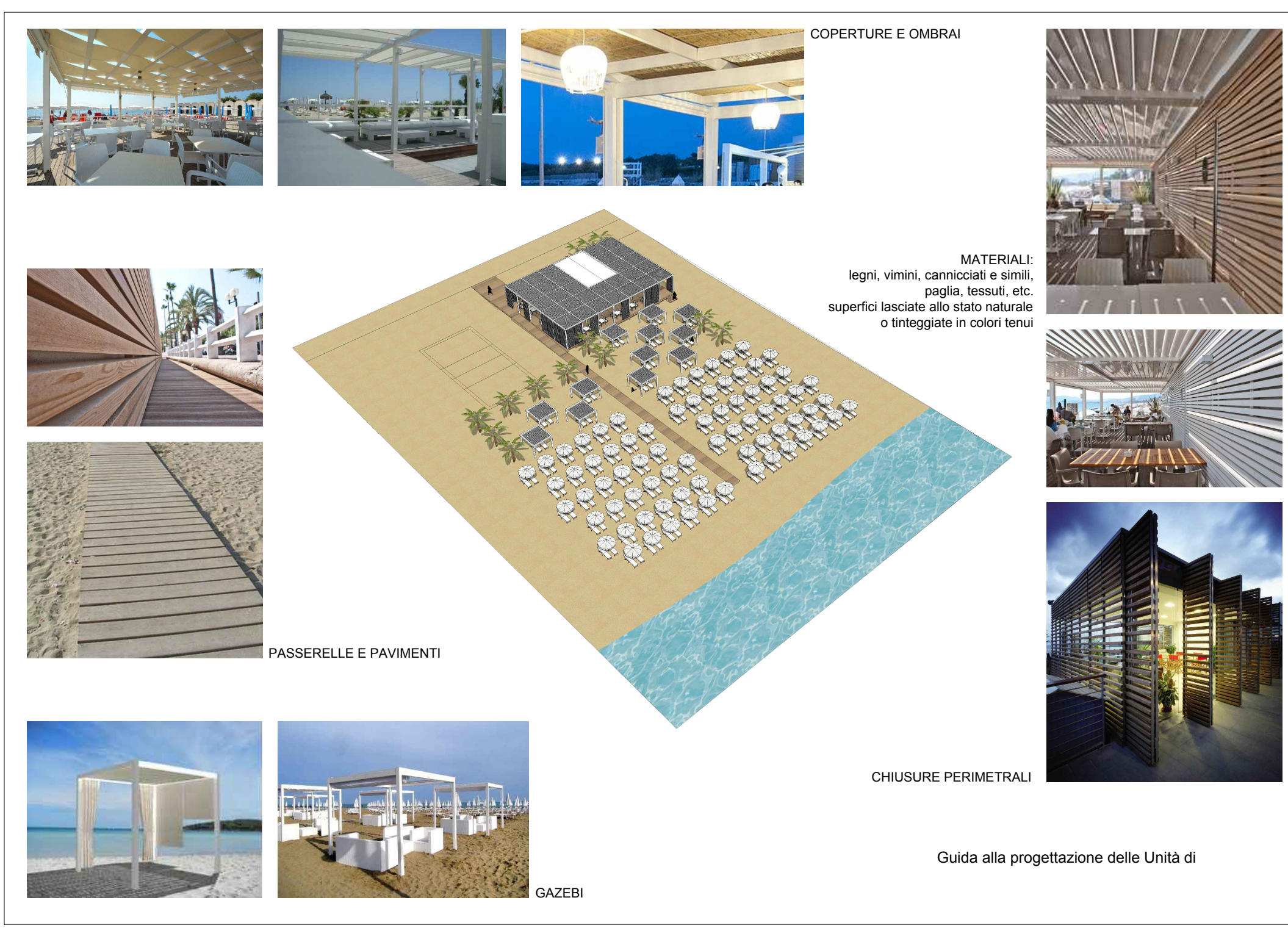
Guida alla progettazione delle Unità di