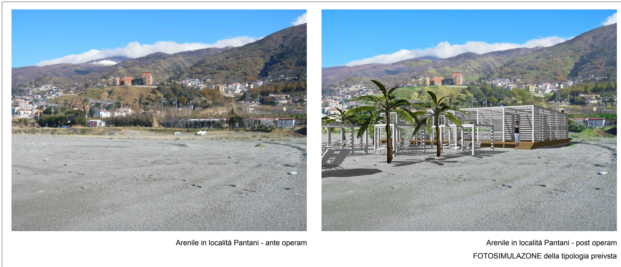
Arenile in località Pantani - ante operam