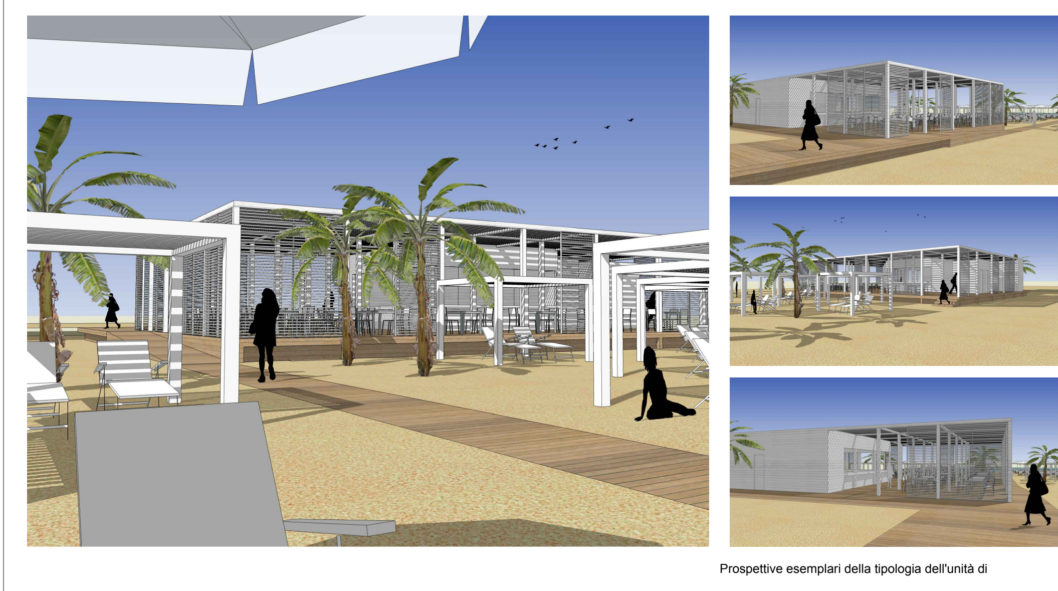
Prospettive esemplari della tipologia dell'unità di